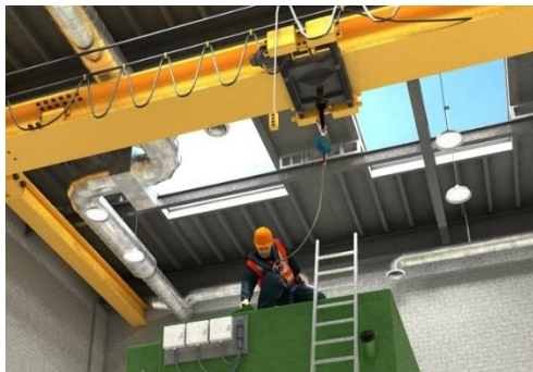
Bild 1: Beispiel einer bestimmten Arbeitssituation Reparatur am Kopf einer Hydraulikpresse

Krane sind grundsätzlich nicht für die Personensicherung gegen Absturz vorgesehen. Unter besonderen Voraussetzungen und strikter Einhaltung der spezifischen Sicherungsmassnahmen kann dies dennoch in bestimmten Arbeitssituationen in Betracht gezogen werden.