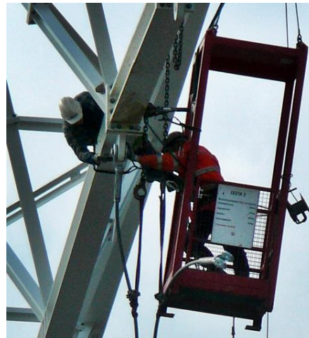
3 Teamarbeit bei komplexer Stahlbaumontage

D-A-CH-S ist eine internationale Arbeitsgruppe von Experten aus Deutschland, Österreich, Schweiz und Südtirol, deren Ziel es ist, eine länderübergreifende Vereinheitlichung der Regelungen für Absturzsicherungen an hochgelegenen Arbeitsplätzen anzustreben.