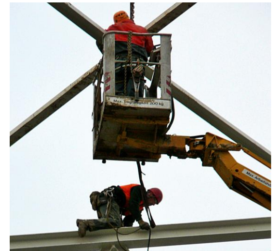
2: Alternative zu Bild 1: Zugang mittels Hubarbeitsbühne