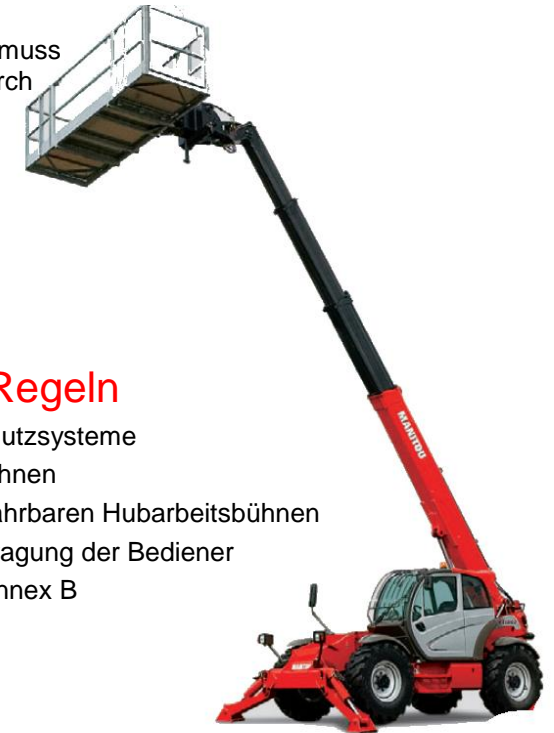
4 Multifunktionsgerät mit schwenkbarem Arbeitskorb und geeigneten Zustiegstüren.

Ein Fangstoss auf den Arbeitskorb muss ausgeschlossen werden, weil dadurch das Gerät unter Umständen zum Umsturz gebracht werden kann.